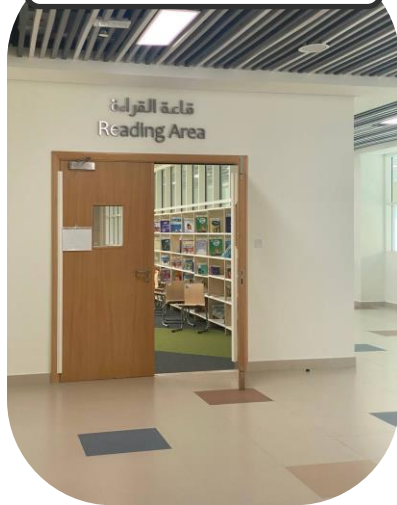
المكتبة/ قاعة القراءة